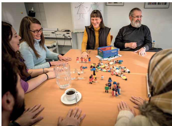
Français pour Réfugiés

«C'est une méthode qui plaît beaucoup aux apprenants. Ils ont envie d'apprendre. Leur enseigner ainsi est un travail extraordinaire dans lequel j'ai trouvé et trouve encore beaucoup de plaisir.»